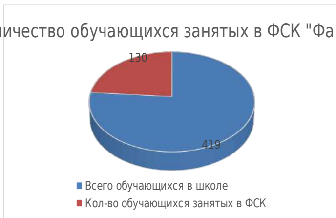
Количество обучающихся занятых в ФСК "Факел"

После проведенного мониторинга занятости обучающихся «Крутоярской средней школы» в дополнительном образовании,